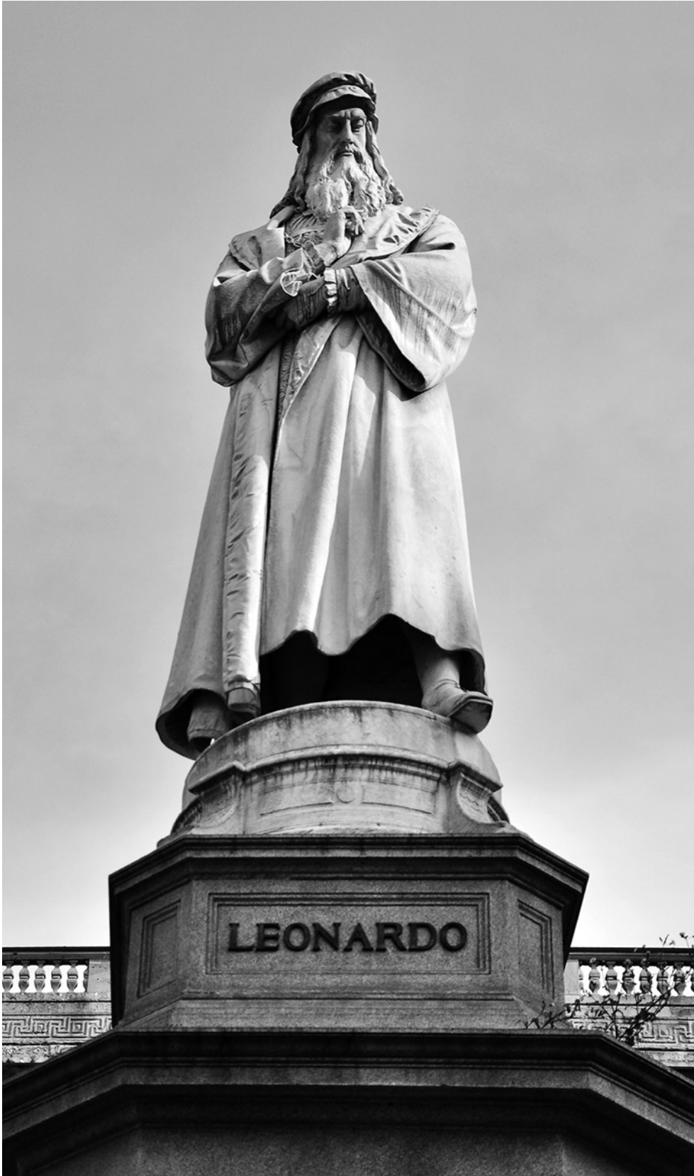
Monumento a Leonardo da Vinci Piazza della Scala Milano