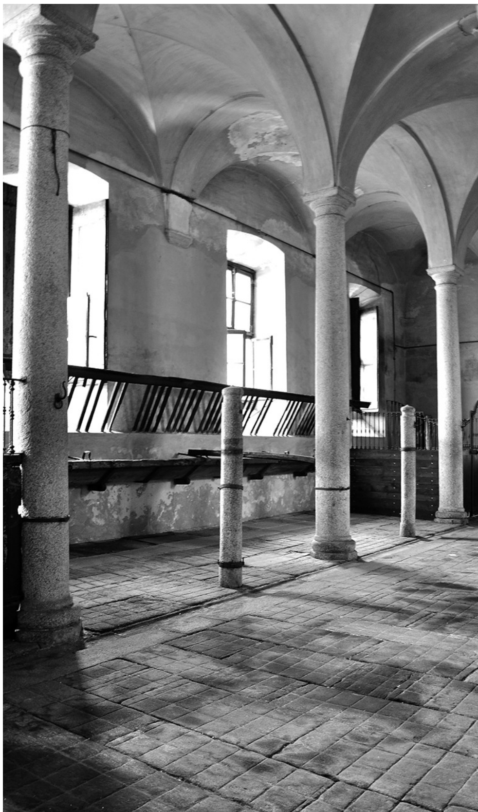
Scuderie di Villa Arconati Bollate (MI)