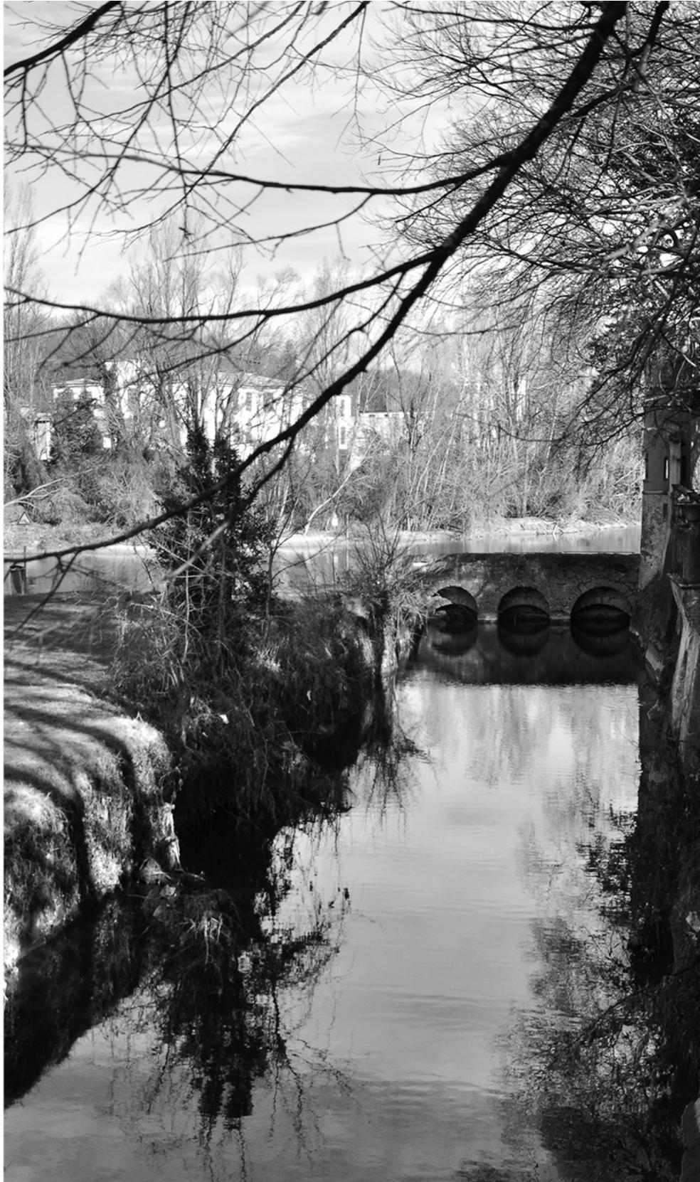
Il corso dell'Adda tra Vaprio e Canonica d'Adda visto dall'opera di presa della roggia di Vailate